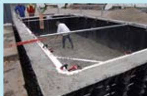
5. Alisamento do fundo