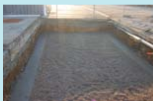
1. Escavação para fundo plano