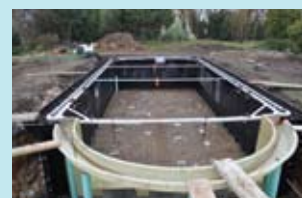
4. Enchimento com betão