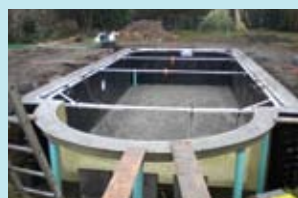
3. Instalação de armação de ferro