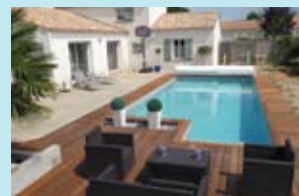
8. Exemplo de acabamento possível