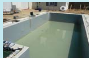
7. Enchimento da piscina