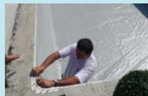
6. Instalação do liner