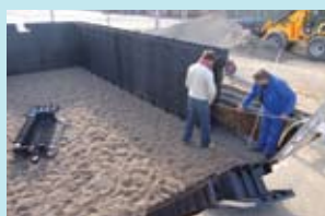
2. Instalação painéis cofragem perdida